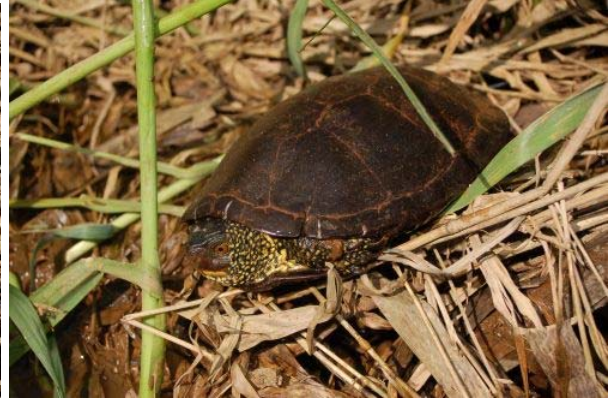
Priloga 5: Fotografije z dne 6.3.2009.